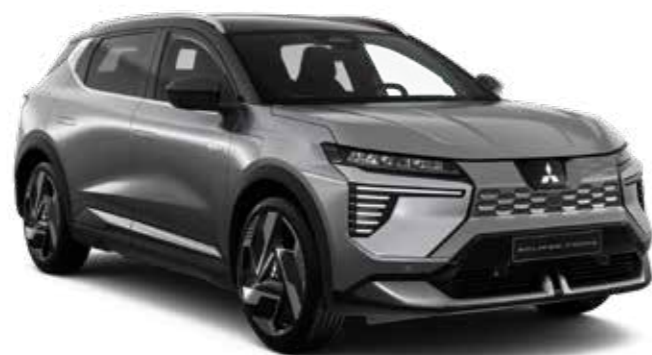
Volcanic Grey (metaallak) - € 800