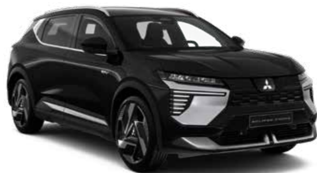
Onyx Black (metaallak) - € 800