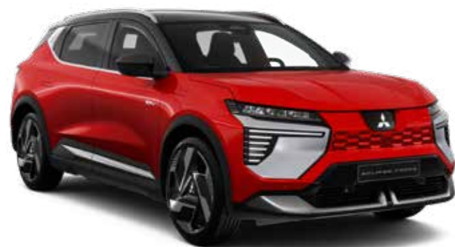
Sunrise Red (metaallak) - € 0