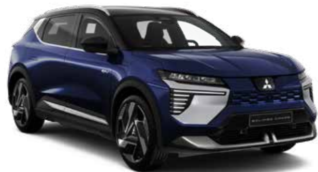
Sapphire Blue (metaallak) - € 1.000