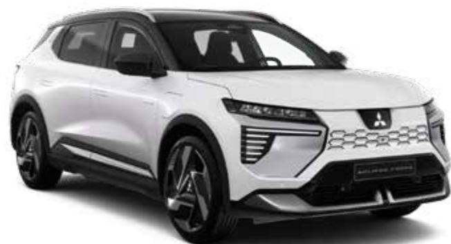
Crystal White (metaallak) - € 1.000

Zwart dak i.c.m. Sunrise Red - € 1.500 Zwart dak (bovenop metaallakprijs) m.u.v. Sunrise Red - € 500